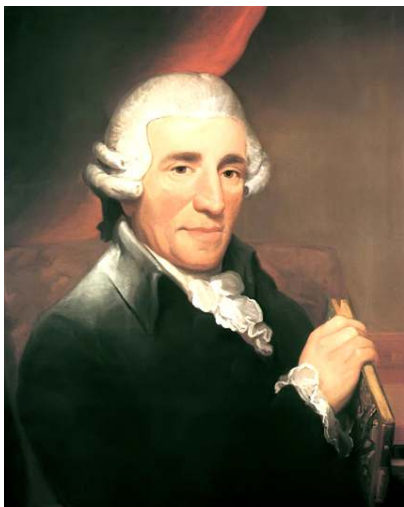
Franz Joseph Haydn. Retrat de Thomas Hardy, Londres 1791

Músic, locutor-redactor de Catalunya Música i divulgador musical