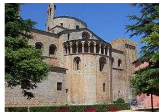
Catedral de Santa Maria de la Seu d'Urgell

D'aquest conjunt destaca la Catedral de Santa Maria , única catedral romànica que es conserva a Catalunya on s'hi deixen sentir fortes influències del romànic de la Llombardia.